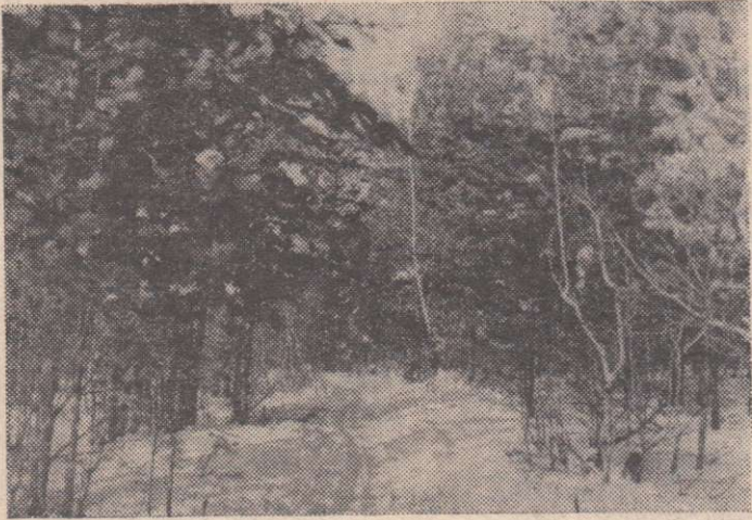
И где-то там начало сказки...